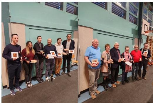
Les podiums du jour : à gauche le général à droite les Aînés