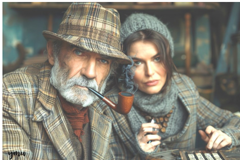
Les enquêtes de Jules Timerag et de la capitaine Amalure.

RUNNEUSES, joueurs qui venaient de terminer leur échauffement dans le parc voisin, menaient une discussion très animée. Ils furent rejoints par une RIPEUSE, RAMONEUSE de formation, venue nettoyer les aires de jeu où se trouvaient tout un tas d'objets divers, un vrai RAPAILLAGE ! Elle affirmait avoir vu un individu RACISER les lettres, une pratique déloyale où l'on trie secrètement les lettres pour gagner. Il pourrait s'agir de Danny Acone, célèbre joueur RAMBOLITAIN et REAGANIEN dans les années 80. Mais il ne pouvait être le coupable : Navy Estrum l'avait bien vu tout occupé à RELÉCHER les assiettes du dîner. Qui trop RELÈCHE REVOMIRA. Navy Estrum avait donc BOOTÉ le système une première fois et suivait attentivement le REBOOT afin que les vidéos et les scores s'affichent enfin correctement.