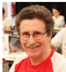
Philippe BUDRY Relecteur