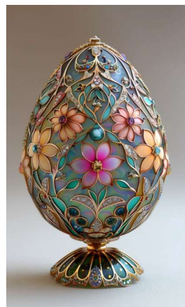
Dessiné par IA - Style Fabergé

POUVOIR REPENTIR SAVOIR SOUVENIR TAPIR COUDRE TENDRE